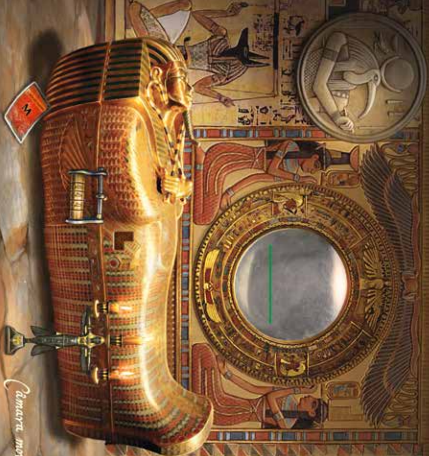
Cămara mortuară a lui Tutankhamon